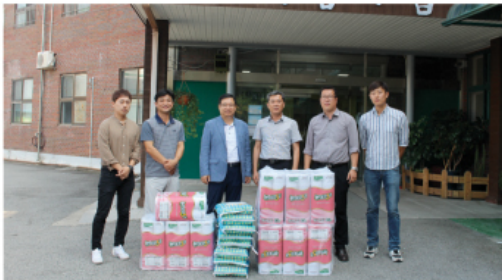
9/25 충주도로관리공사 후원물품 전달