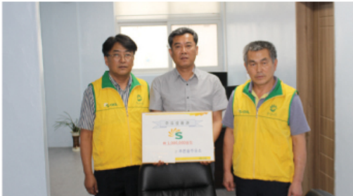
9/19 에스오일 주유상품권 100만원 전달