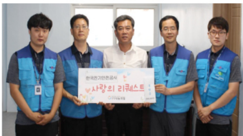
9/26 한국전기안전공사 충주읍성지사 80만원 후원금 전달