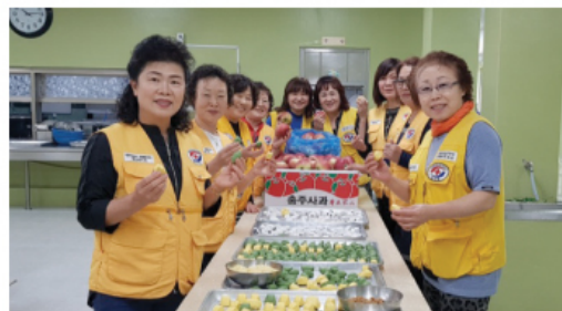
9/28 햇살적십자 후원물품 전달 및 송편 빚기