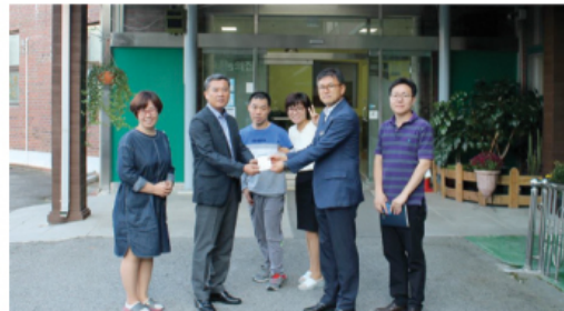
9/28 국도로공사 충주지사상품권 100만원 전달