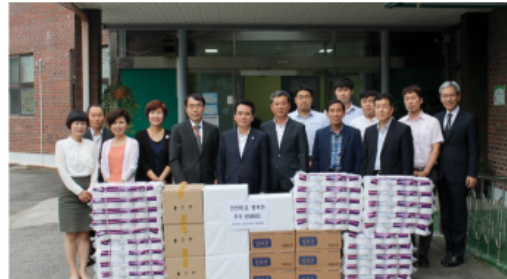
9/26 도청 재난안전과 후원물품 전달