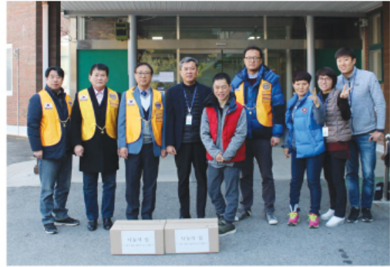
2/7 중원MJF라이온스클럽 후원물품 전달