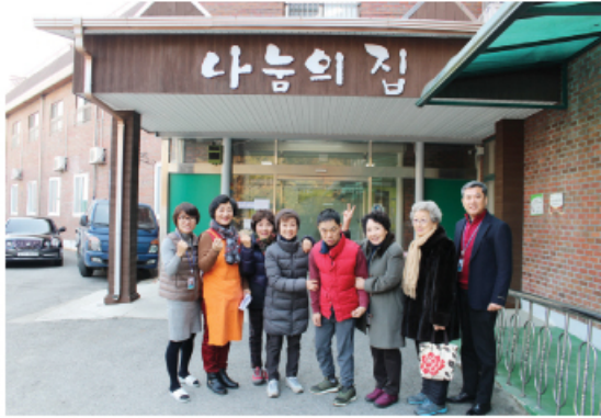
1/22 나눔사랑회 후원물품 전달 및 봉사활동