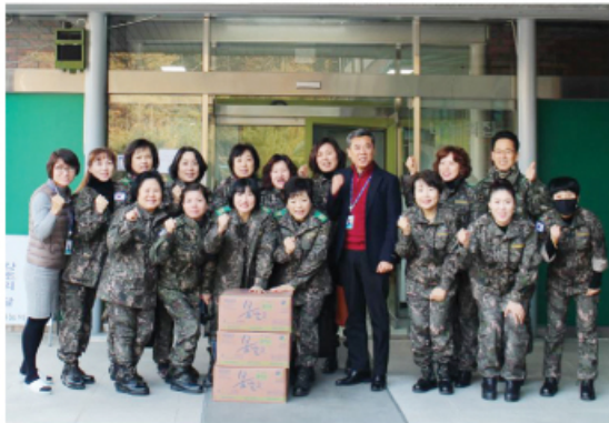
2/8 충주시여성예비군 후원물품 전달 및 봉사활동