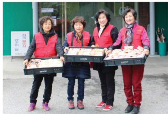
3/20 나눔사랑회 후원물품 전달 및 봉사활동