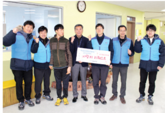
2/9 한국전기안전공사 후원금 80만원 전달