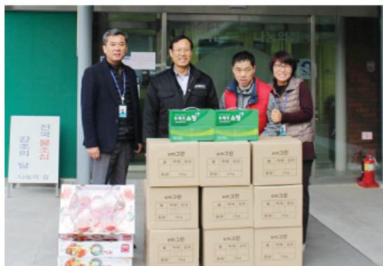
2/9 호암직동주민센터 후원물품 전달