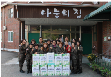
11/13 충주시 여성 기동대 후원물품 전달 및 봉사활동