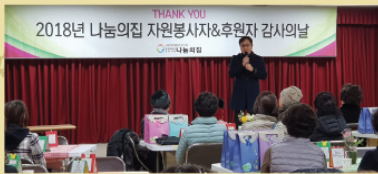
2019년 12월 10일 나눔의집 자원봉사자 및 후원자분들을 한자리에 모시고 감사한 마음을 전달하기 위한 감사의날을 진행하였습니다.