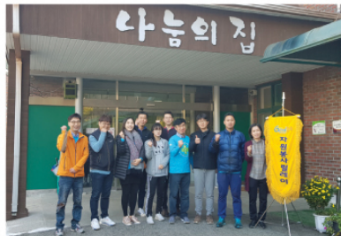
11/13 추보그유퍼 김장행사 지원