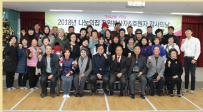
2018년 한 해 동안 이용인과 직원 모두 건강하게 보낼 수 있었던 것은 나눔의집을 아껴주시는 많은 분들이 계시기에 가능하지 않았나 생각합니다. 한 해 동안 보내주신 정성 진심으로 감사드리며, 더 큰 기쁨으로 보답할 수 있도록 나눔의집 직원 모두가 최선을 다하겠습니다. 2019년에도 나눔의집과 함께 해주시기를 기원합니다. 새해 복 많이 받으세요~^^