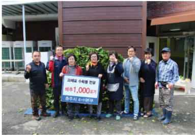
11/9 충주시 4-11대부 배추 후원