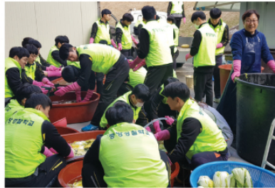
11/12 중앙경찰학교 김장행사 지원