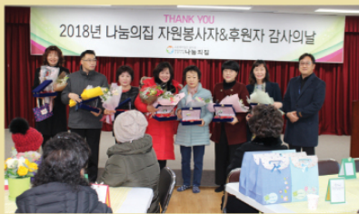
또한 2018년 한 해 동안의 영상을 감상하며 지난 시간을 되새기는 시간과 함께 나눔의집을 위해 노력해주신 후원자 및 자원봉사자 분들께 감사패를 전달하며 감사인사를 드리는 시간을 가졌습니다.