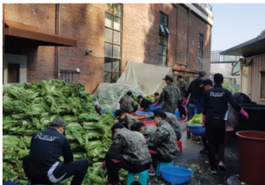
11/12 제 19전투비행단 김장행사 지원